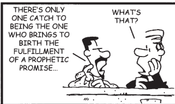
4TH SUNDAY OF ADVENT

Những ÔBACE nào biết có ai có ý muốn trở thành Kitô hữu, hay những ai thích tìm hiểu niềm tin Kitô giáo, xin cho chúng tôi biết để chúng tôi đến gặp gỡ quý bạn. Xin gọi cho ông Khương 651.228.1959 hay Cha xứ. Đa tạ.